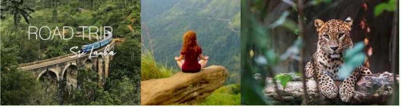
শ্রীলঙ্কা অবকাশ - নির্দেশিত প্রকৃতি ভ্রমণ এবং অভিযান

সময়: পরীক্ষাটি COVID-19 মহামারী চলাকালীন চালু করা হয়েছিল, যখন শ্রীলঙ্কার পর্যটন-নির্ভর অর্থনীতি ইতিমধ্যেই মারাত্মকভাবে প্রভাবিত হয়েছিল।