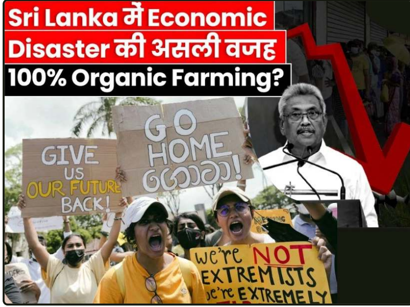
ශ්‍රී ලංකාවේ ආර්ථික විපර්යාස